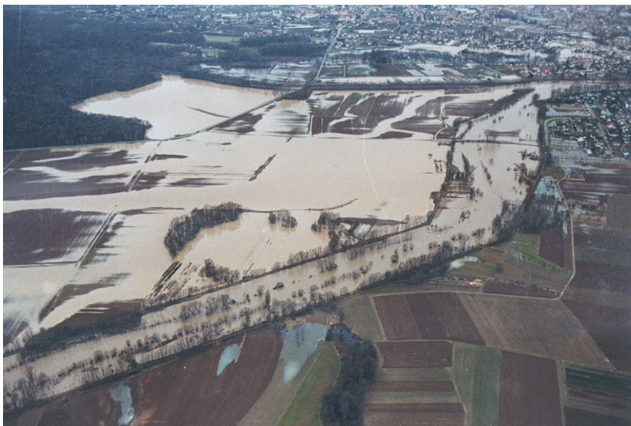
Crue de l'Il l en février 1990 (champ d'expansion de crue en rive gauche à Horbourg-Wihr et rupture de la digue à Colmar)