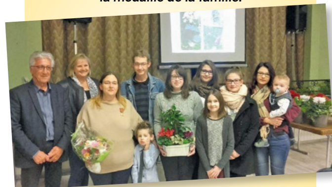
Nous la félicitons sincèrement.