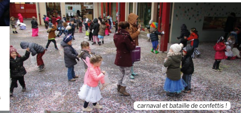
carnaval et bataille de confettis !