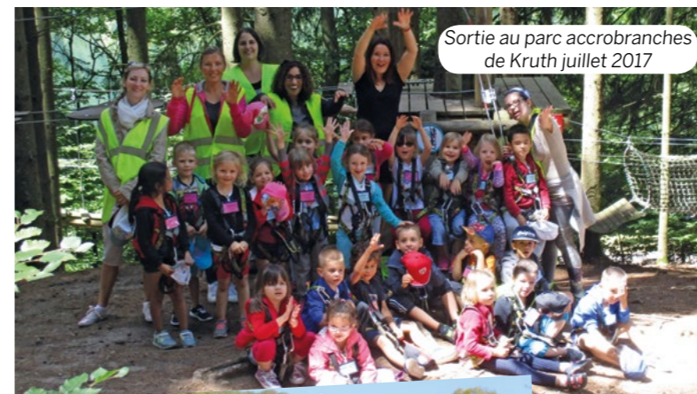
Sortie au parc accrobranches de Kruth juillet 2017