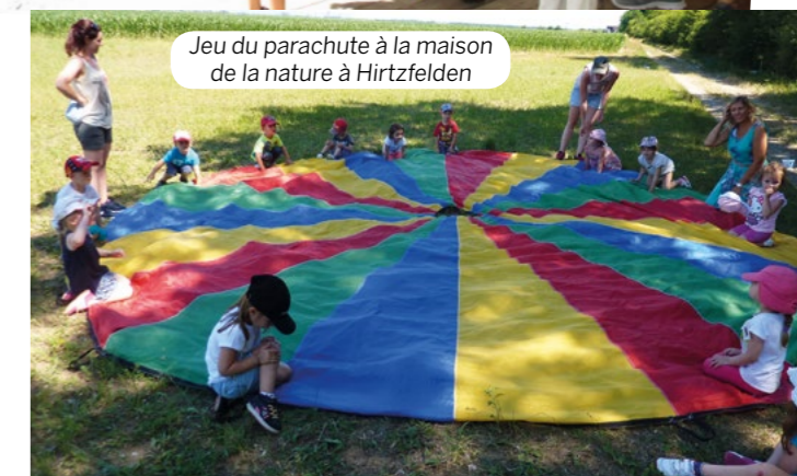
Jeu du parachute à la maison de la nature à Hirtzfelden