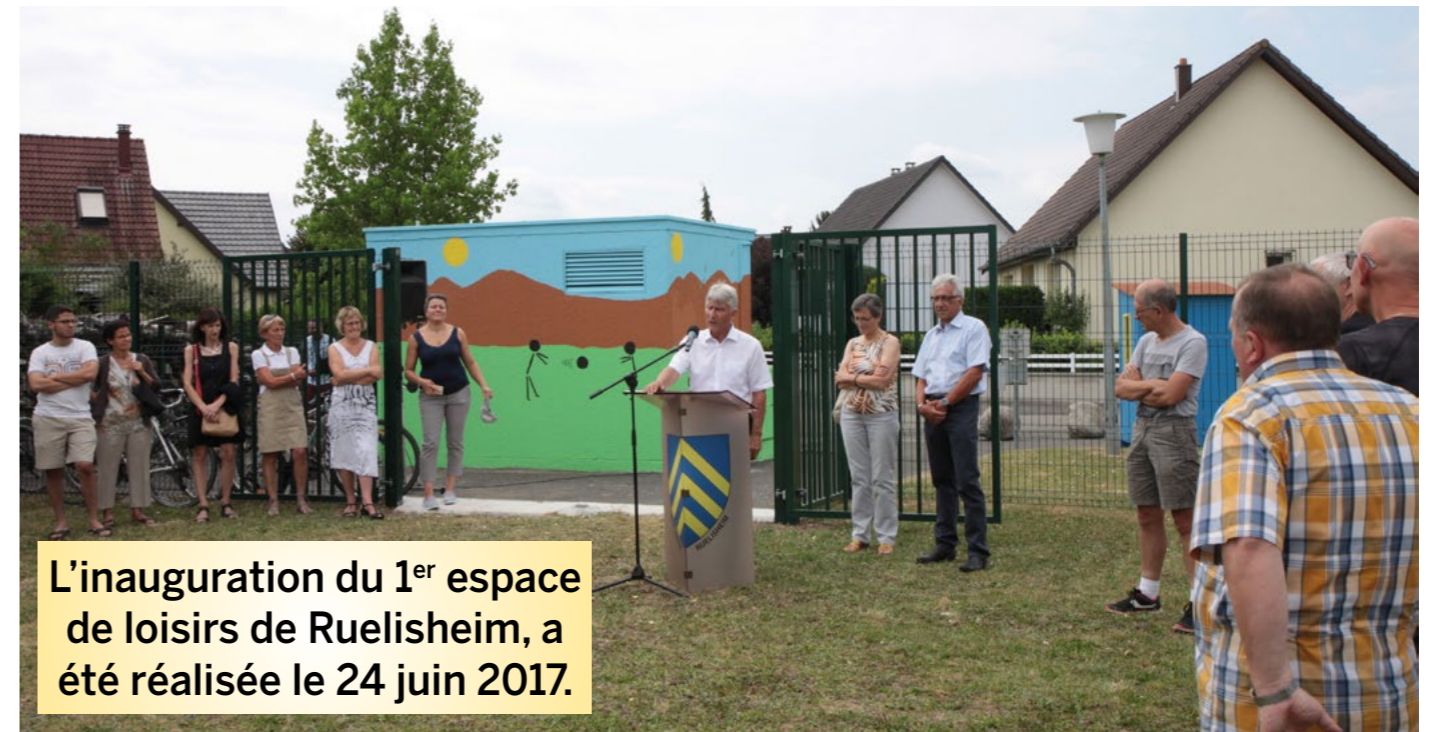
L'inauguration du 1 er espace de loisirs de Ruelisheim, a été réalisée le 24 juin 2017.