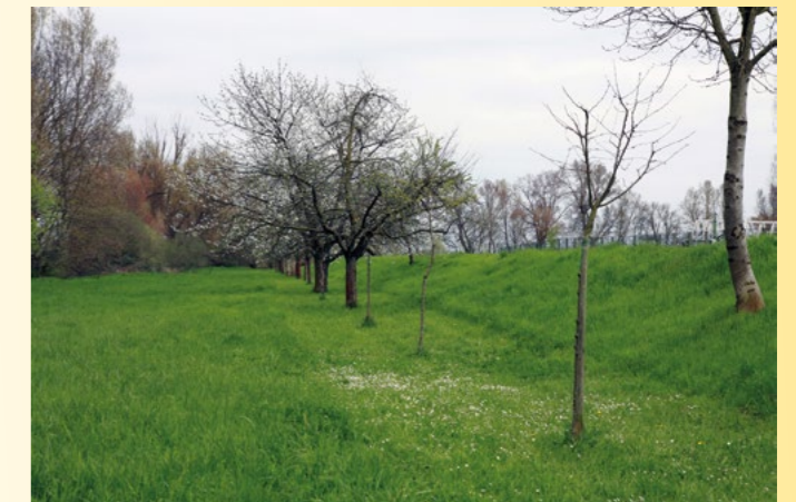
Verger de l'association le long de la digue de l'III.