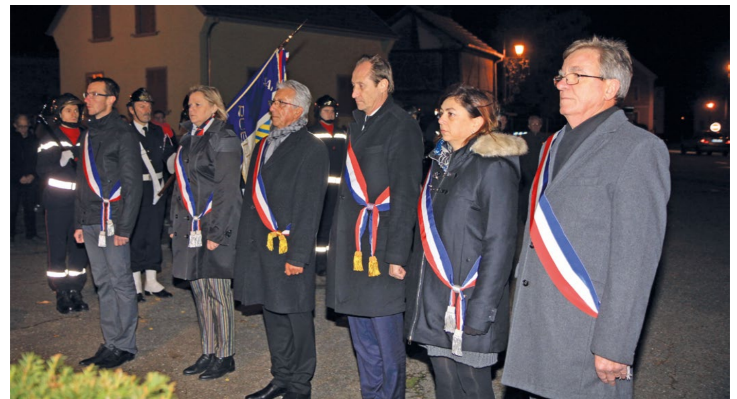
La commémoration du 11 novembre c'est déroulée en présence de notre député, M. Bruno FUCHS