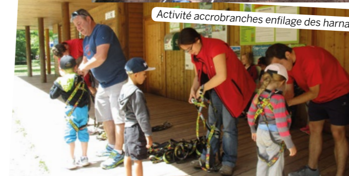
Activité accrobranches enfilage des harnais