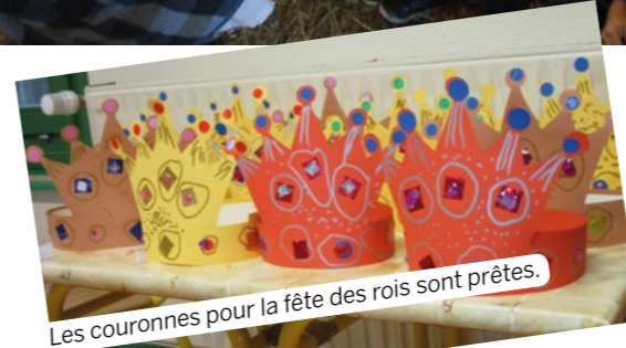
Les couronnes pour la fête des rois sont prêtes.