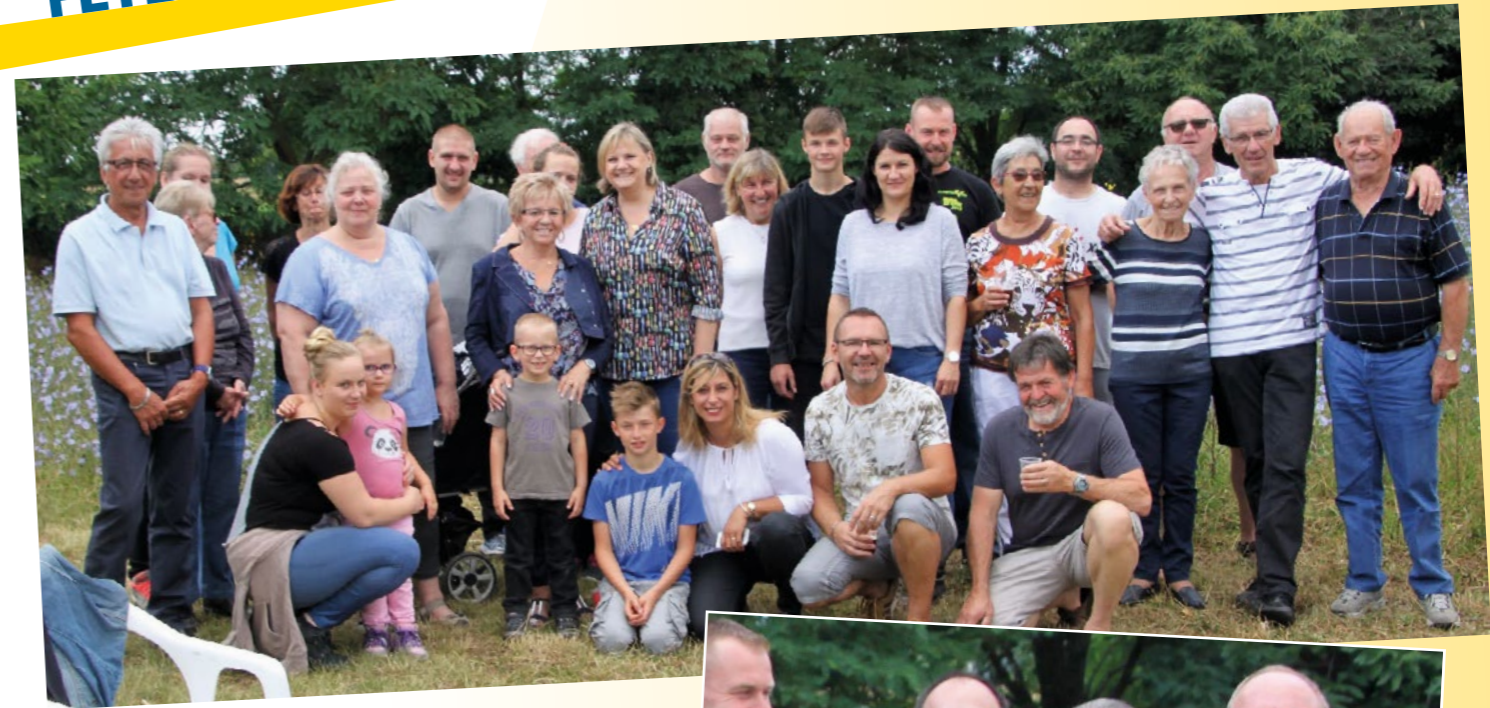
Rues de Wittenheim, du Bois, d'Illzach et Chemin de Sausheim