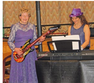
L'intergénération : la magie des échanges, les liens se tissent