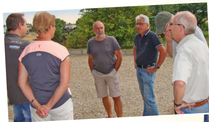
Rues de Deauville et de Talloires.