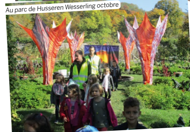
Au parc de Husseren Wesserling octobre