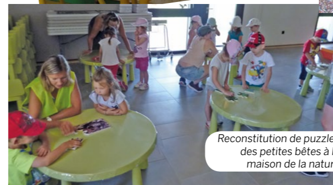
Reconstitution de puzzles des petites bêtes à la maison de la nature