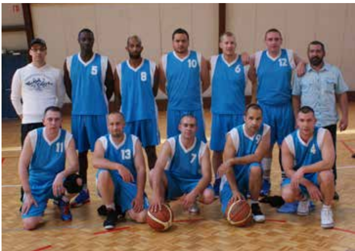
Les Séniors Masculins 2 qui vont évoluer en Promotion d'Honneur.