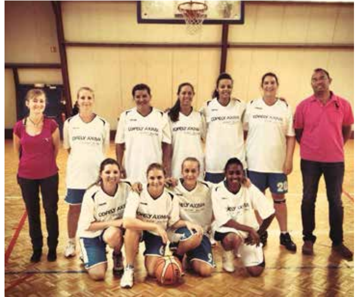
Les Séniors Féminines 2 qui rejoignent la Promotion d'Excellence et deviennent désormais les Séniors Féminines 1.