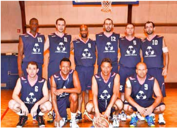
Les Séniors Masculins 1 du NBR qui montent pour la 3 ème année consécutive.